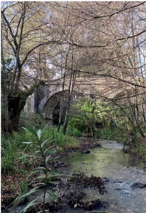
Veel rivieren in Andalusië beginnen met de letters GUAD, afkomstig van het Arabische WADI, dat rivierdal betekent.